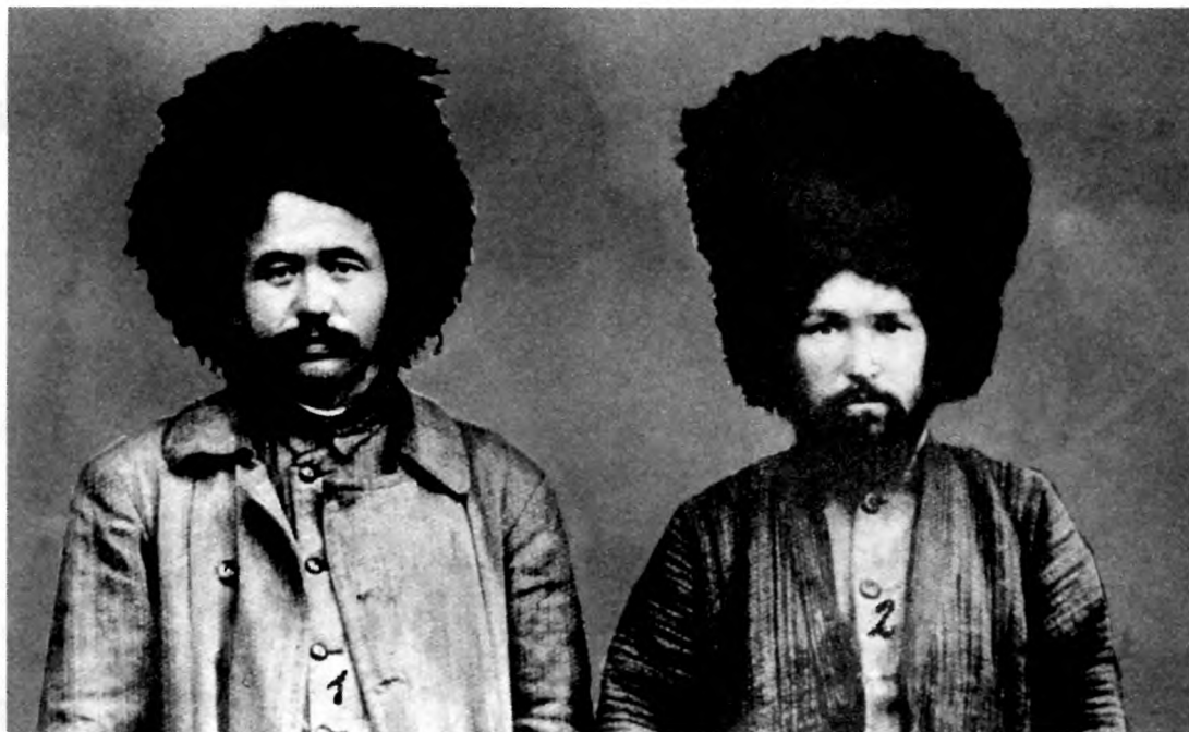
1) Абделькадир Инан, 2) Заки Валиди Тоган в туркменской одежде, январь 1923 г.