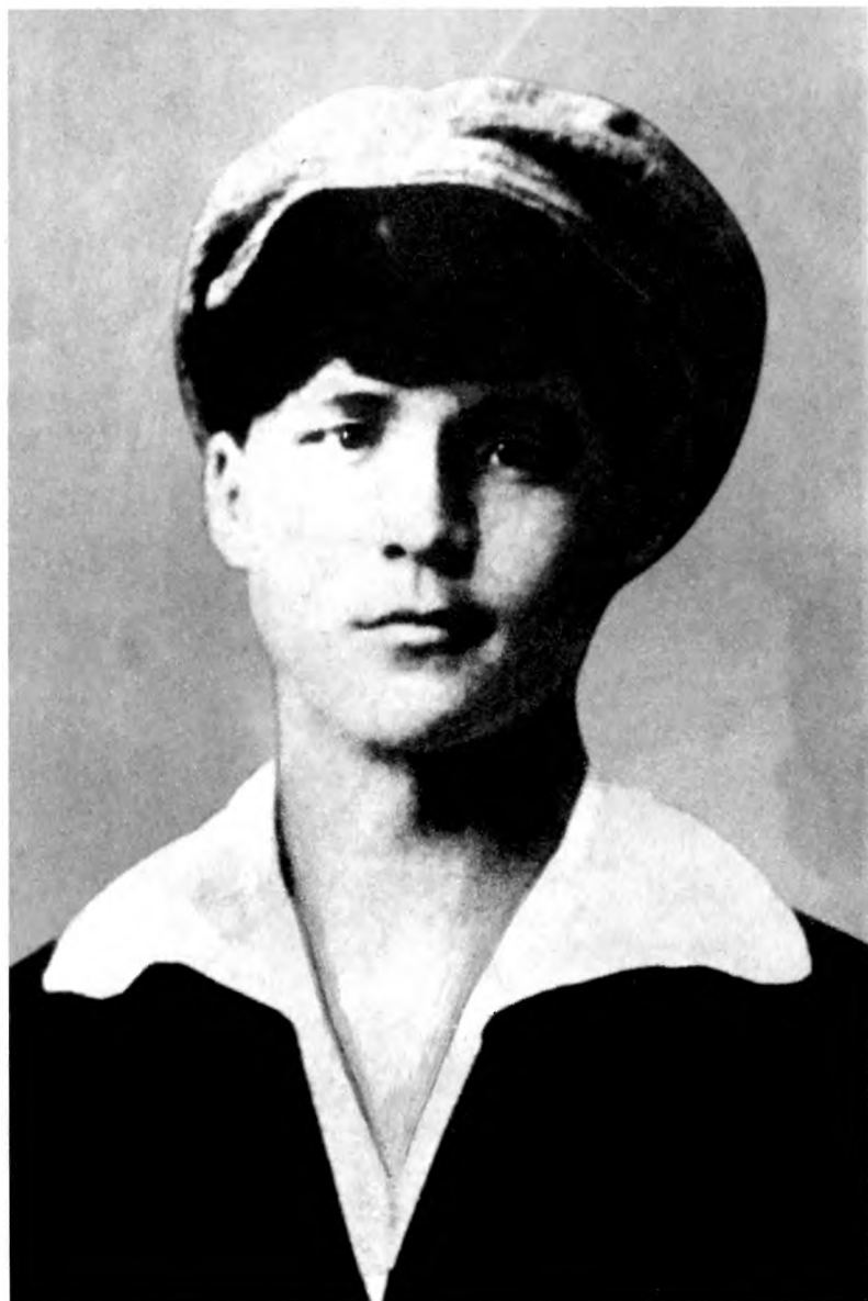
Казакский поэт и артист Динше, представлявший Алаш Орду в Бухаре и Самарканде.